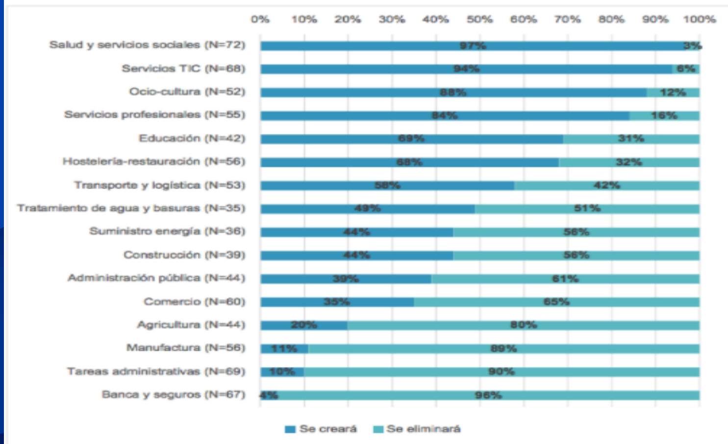
Gráfico 5. Sectores de actividad según previsión de variación del empleo en España, horizonte 2025 (ordenados según diferencias de mayor a menor entre respuestas "se creará" y "se eliminará")