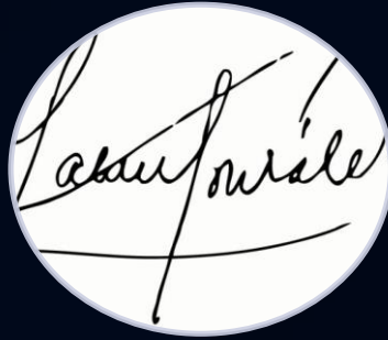
Firma Electrónica simple