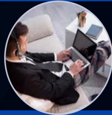
Firma Electrónica certificada